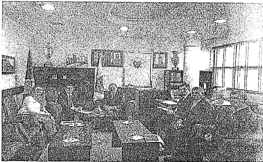
Foto e realizuar gjatë takimit në Komunën e Drenasit.