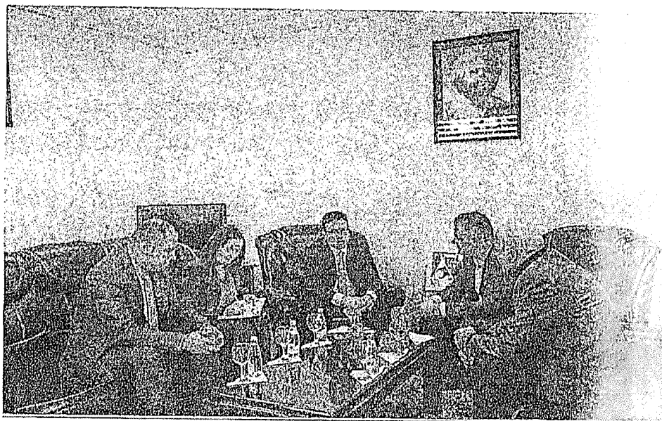
Foto e realizuar gjatë takimit.

Kërkuan investime kapitale në të gjithë infrastrukturën, ku ka mundësi MKK-ja që të investojë.