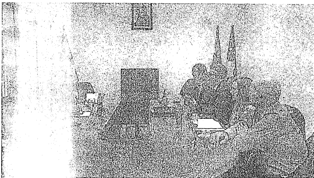
Foto e realizuar gjatë takimit në Komunën e Drenasit.