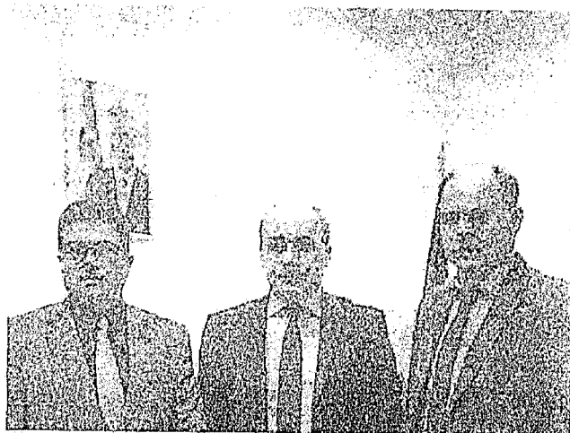
Foto e realizuar gjatë takimit